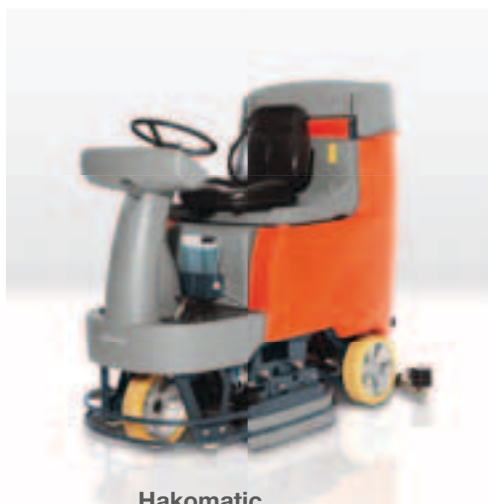
Hakomatic B 115 R schijfborstel