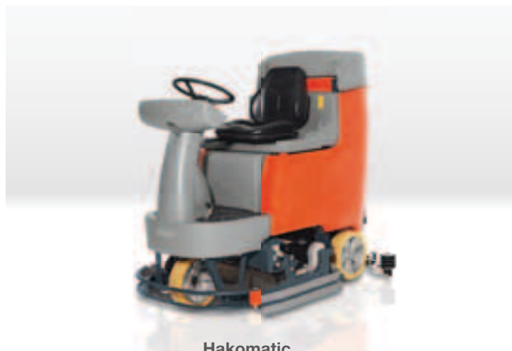
Hakomatic B 115 R walsborstel