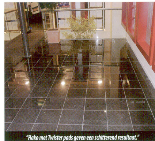
"Hako met Twister pads geven een schitterend resultaat."

Het geeft aan dat alles nauwkeurig op elkaar is afgestemd zodat er geen schade aan de vloer kan ontstaan en dat men tijdens de normale dagelijkse reiniging, zonder extra tijdsinspanning, de vloer weer zijn origineel glans terug geeft.