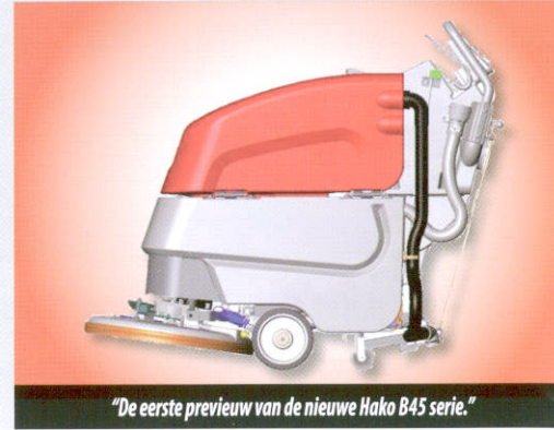
"De eerste preview van de nieuwe Hako B45 serie."

Deze serie rendementsvolle reinigingsmachines biedt tal van voordelen. Naast de verbeterde reinigingsresultaten is de Hakomatic B45 ook opvallend efficiënt bij te reinigen vloeroppervlakken van meer dan 100 m 2 in vergelijking met handmatig boenen en dweilen. De Hakomatic B45 heeft alle voordelen die u al gewend bent van Hako, maar zowel de bediening als het resultaat zijn naar een nóg hoger niveau gebracht. Zoals nog minder geluid en meer reinigingsresultaat in minder tijd. Uiteraard houden wij u binnenkort met meer details op de hoogte.