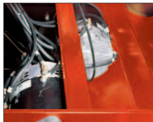
Antriebsachse mit 2 E-Motoren sorgen für optimale Leistung.