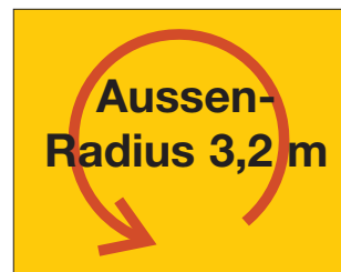
Ideal für enge Gassen und Kehren.