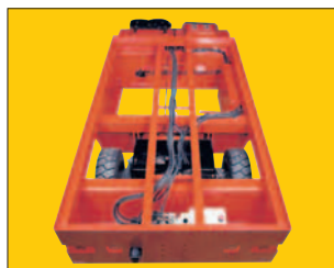
Robuste Rahmenkonstruktion, das Rückgrat für Langlebigkeit.