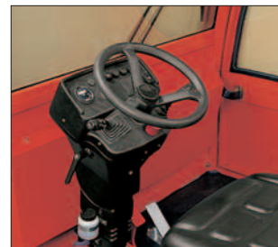
Komfort-Arbeitsplatz mit viel Übersicht plus Beifahrersitz.