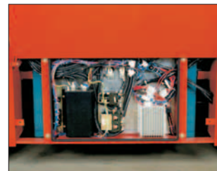
Guter Zugang zu allen Aggregaten bei Wartung und Service.