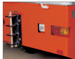
Alle Rückleuchten stoßgesichert montiert.