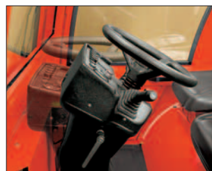
Verstellbare Lenksäule – entspannter fahren.